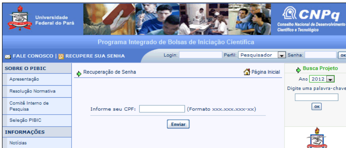
Figura 02 – Função “Recupere sua Senha”, informando o CPF.

Passo 02 – Informe seu CPF e clique na opção “Enviar”, conforme a figura 02. Caso tenha informado um CPF válido o sistema buscará suas informações na base de dados e as enviará para o endereço de email cadastrado no sistema.